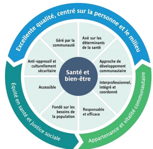
La directrice générale